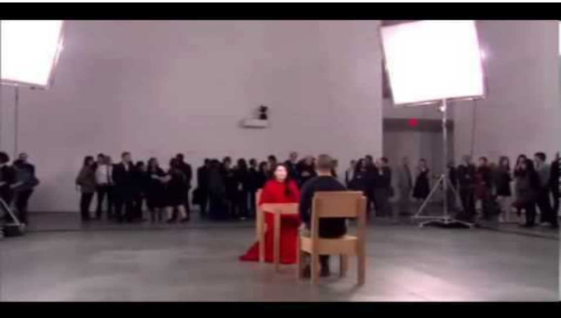
Marina Abramovitz: The Artist is Present (MoMA, 2010)