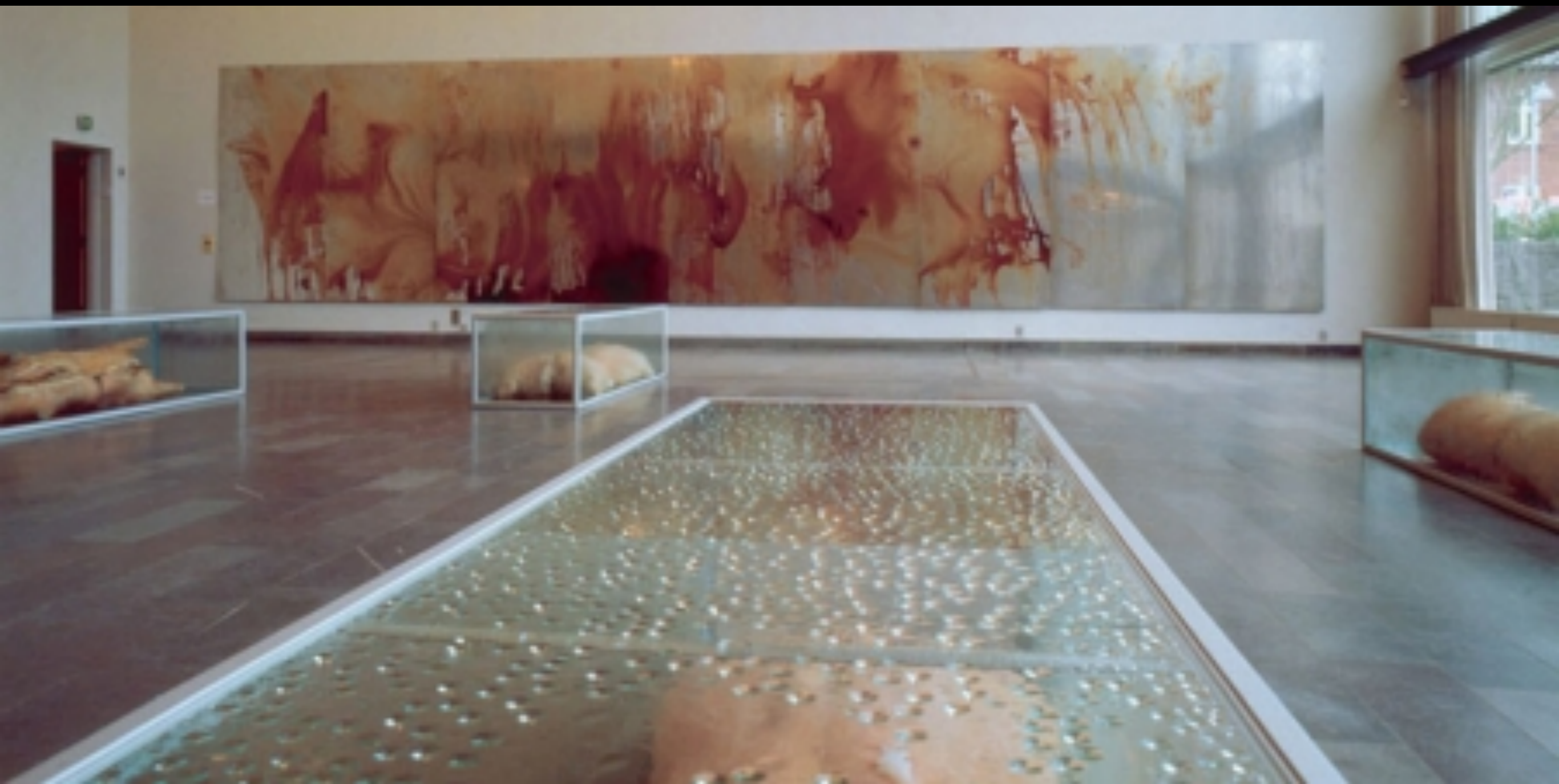
Christian Lemmerz, Scene (1994)