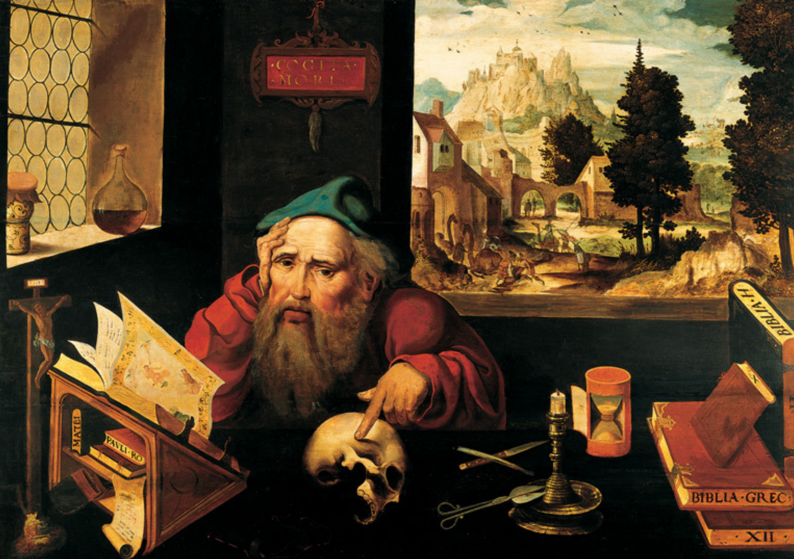
Joos van Cleve, Den heilige Hieronymus (1520-25)